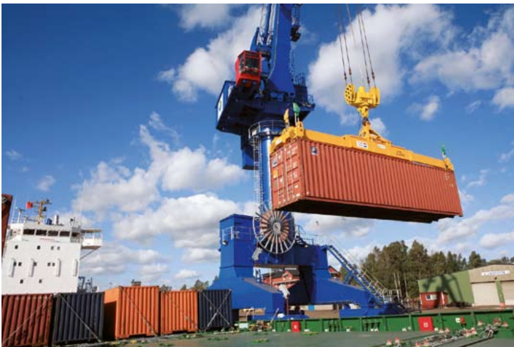
Containertrafiken har nu varit igång i två år i Oxelösunds Hamn.