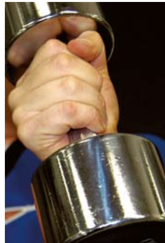
Många utnyttjar friskvårdskortet.