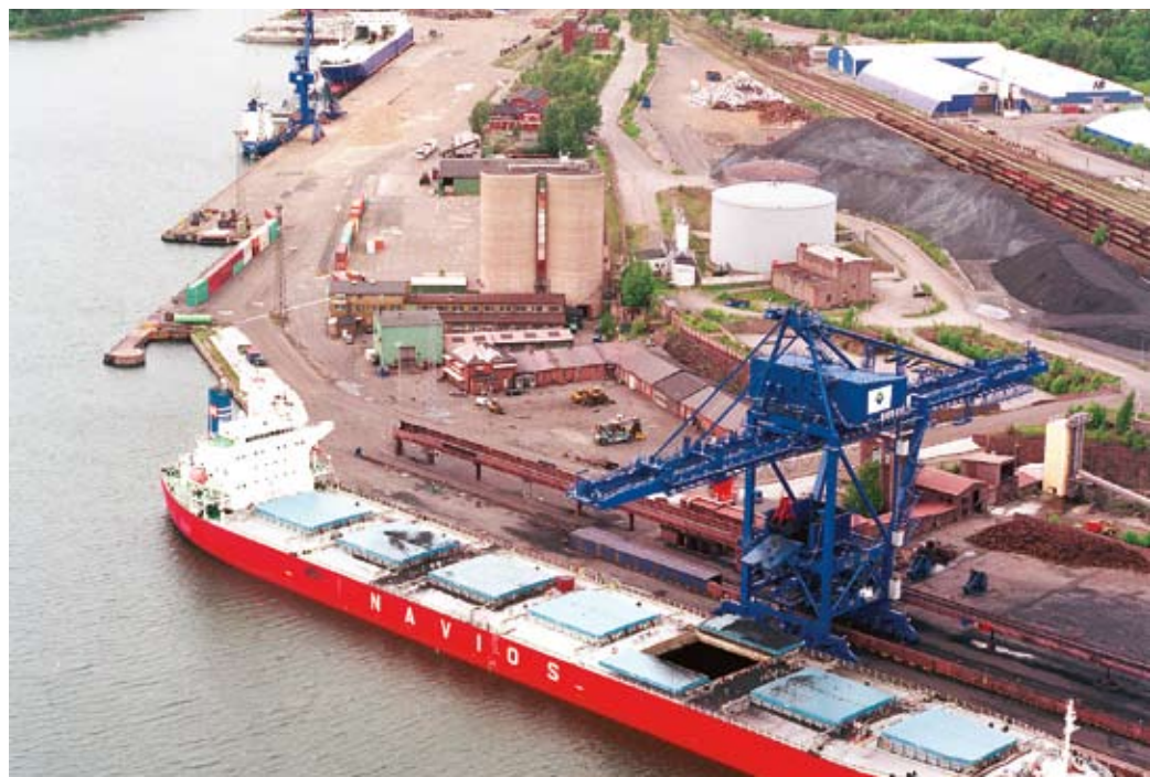
Första lösningen med Pinglan.