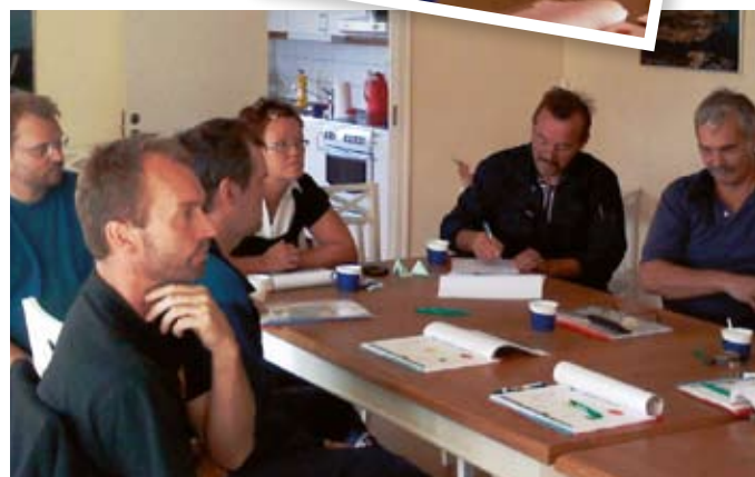
En terminalstyrka bestående av fem personer har tillsatts och genomgår här en halvdags internutbildning.