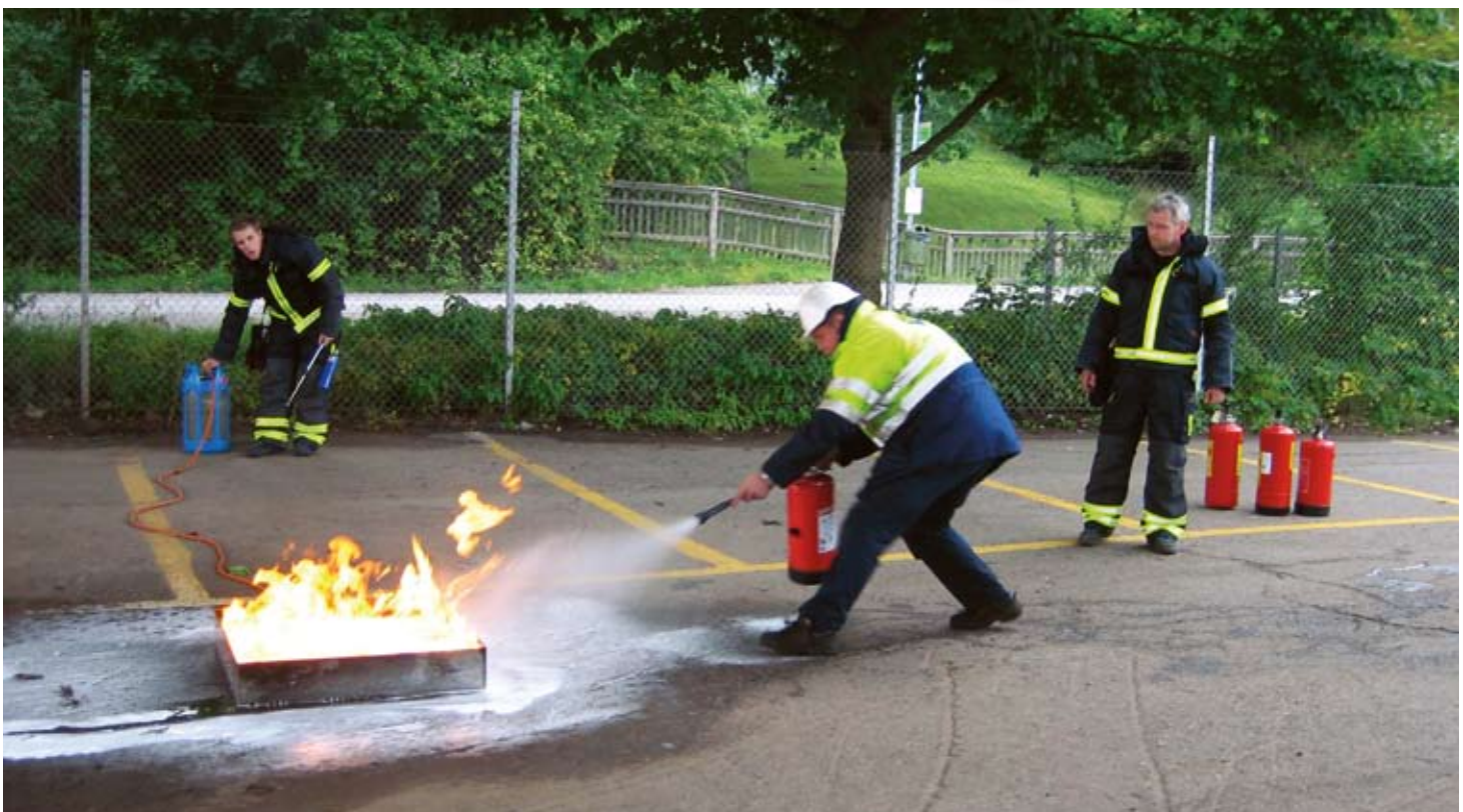
I september genomfördes grundutbildning i brandskydd i Oxelösunds Hamn.