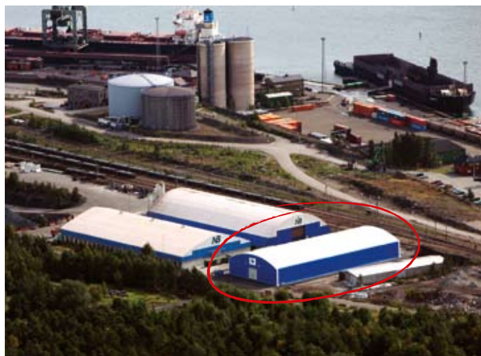
Nya Magasin 1 står nu klart med sina 2.160 m 2 .