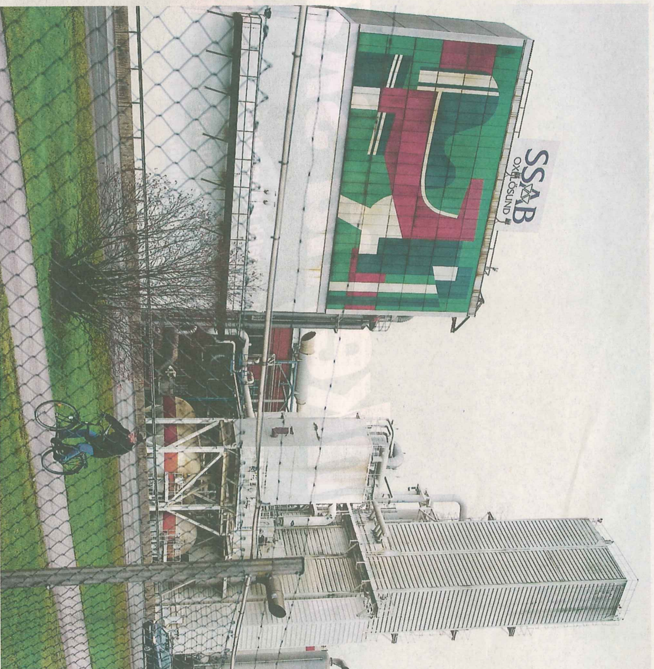
När SSAB varslade 1 000 personer i början av december förra året höll de anställda på stälverket i Oxelösund andan. Hela stället är beroende av kommunens största arbetsgivare. Dör järnverket, dör Oxelösund.

Av enskilda län ökar arbetslösheten mest i Västra Götaland med 1,4 procentenheter. Nästan lika stora ökningar sker i Jönköpings, Gävleborgs och Västerbottens län. Norrbotten och Dalarna klarar sig bäst. Källa: Arbetsförmedlingen