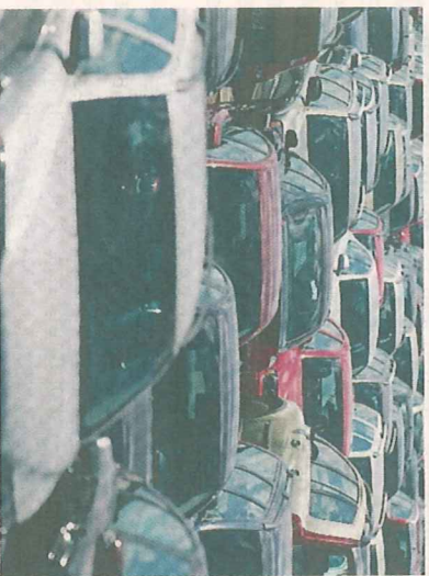
Biljättarnas varsel skapar problem i Göteborgs-området.