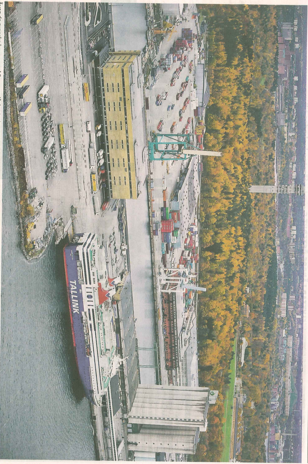
Även de svenska hamnarna känner av lågkonjunkturen, men mest vad gäller frakt. På bilden Värtahamnen och Frihamnen i Stockholm.