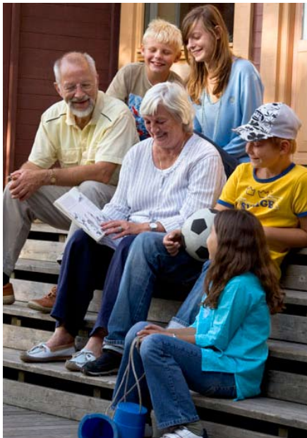
"Klassmorfar" är ett av projekten som får EU-medel.

Strukturfondpartnerskapet för Mål 2 Östra Mellansverige beslutade vid sammanträdet den 15 april att prioritera 34 projekt i Östra Mellansverige. Projekten får tillsammans 42 miljoner kronor i EU-stöd. Av dessa pengar går cirka 4,2 miljoner kronor till projekt i Sörmland.