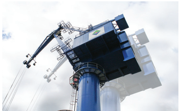
I sommar får Petronella sällskap av ytterligare en spårbunden 45-tons linkran.