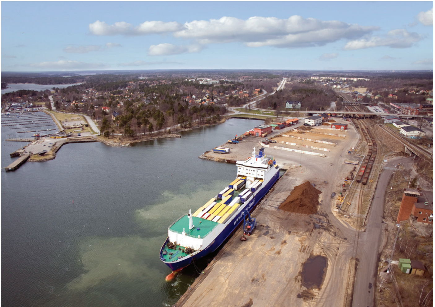
Rorotrafiken mellan Åbo-Oxelösund-Travemünde bedrivs med M/V Global Carrier under rederiet PowerLine. Här ligger fartyget inne vid Oxelösunds Hamns rorokaj.