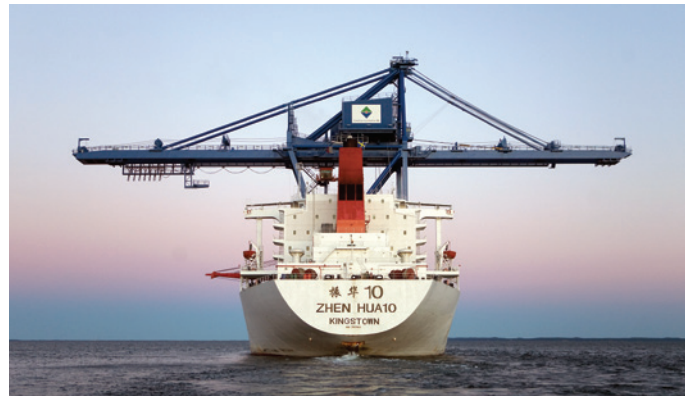
Skeppsslossaren PK 481 - Xiao Ping, "Pinglan", anlände till Oxelösunds Hamn tidigt på morgonen den 18 april efter 83 dygn till sjöss.

För flytande bulk är hamnen en lagrings- och omlastnings-terminal. Den samlade lagringskapaciteten överstiger 1 miljon m 3 i berggrum och cisterner.